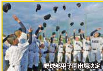
野球部甲子園出場決定

プロ野球選手を輩出していることや天然芝の充実した練習環境に魅力を感じ、この学校で甲子園を目指したいと思いました。授業も様々な施設や設備が整っていて、農業や商業の専門的な勉強をがんばっています。友人や先輩との関わりが増えて、自分の考えが広がってきています。