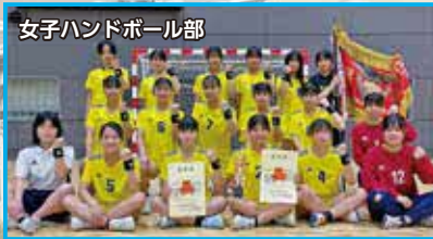
女子ハンドボール部

ハンドボール部の実績を知り、この学校でがんばりたいと思えました。友達もできて、毎日、楽しく過ごしています。豊かな自然に囲まれ、とても落ち着いた環境で勉強と部活動にがんばっています。