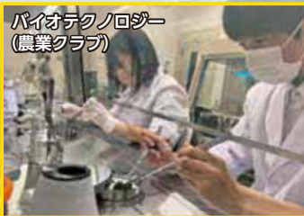
バイオテクノロジー (農業クラブ)