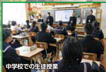
中学校での生徒授業