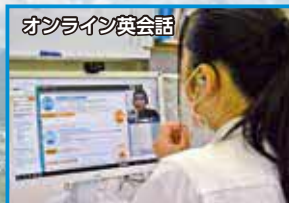
オンライン英会話