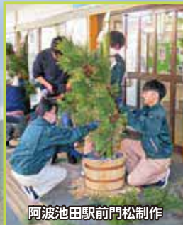
阿波池田駅前門松制作

動植物の観察が好きで、自然の中で様々な動植物にふれあえると考え、この学校を選びました。趣味の合う人が多く、友人も早くできました。勉強や実習もがんばっていますが、良い人間関係が築けるようにがんばっています。