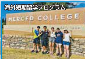
海外短期留学プログラム