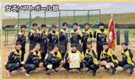
女子ソフトボール部

先輩方が優しく、コーチの指導も良かったので、この学校でソフトボールをがんばろうと思えました。少人数なので友達もすぐにできました。先生方も親身に相談に乗ってくれるので、積極的に学校生活を送っています。「おいしいパン」があるのが、おすすめポイントです！