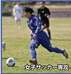
女子サッカー専攻

部活は自主性を重んじていて、先輩の雰囲気も良く、設備も整っているのので、この高校を選びました。木曜日と金曜日には専攻実技(ラグビー)があり、部活動に集中できます。