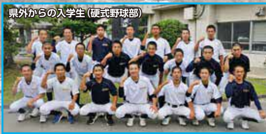
県外からの入学生 (硬式野球部)

この学校なら文武両道を高いレベルで実現できると思えました。クラスは明るい雰囲気ですが、勉強にはとても意欲的です。野球部では新しい学びも多く、先輩方と共に野球をするのが楽しいです。