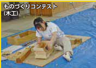
ものづくりコンテスト (木工)