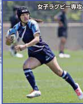
女子ラグビー専攻