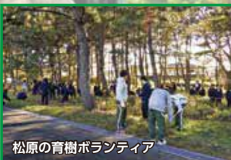
松原の育樹ボランティア