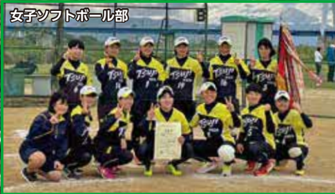
女子ソフトボール部