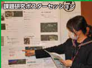
課題研究ポスターセッション