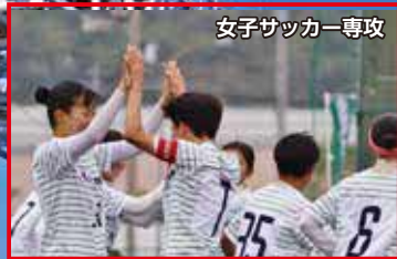
女子サッカー専攻

部活動と勉強が両立できる環境が整っていることを知り、鳴門渦潮高校を選びました。各部活動ごとに、グラウンドや体育館などの練習場所があります。授業は習熟度別クラスになっていて、それぞれの進度にあわせて学習できるところが良いと思います。また多くの選択科目があり、自分の進路目標にあった科目選択ができ、放課後、補習にも積極的に参加しています。学校の敷地内に寮があり、遠距離通学者にはとても便利です。