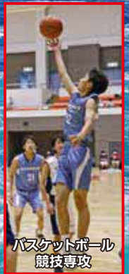
バスケットボール競技専攻