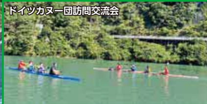
ドイツカヌー団訪問交流会