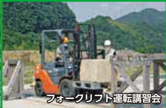
フォークリフト運転講習会