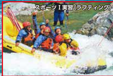
スポーツI実習(ラフティング)