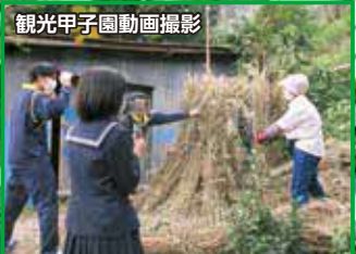
観光甲子園動画撮影