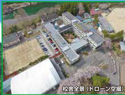
校舎全景 (ドローン空撮)

森林クリエイト科という珍しい学科があり、森林関係の資格や技術を学べると知り、志望しました。また、自然豊かな環境の中なので、落ち着いて勉強やカヌーに取り組んでいます。授業は分かりやすく、分かるまで教えてくれます。将来は取得した資格や技術を生かすことができる仕事に就きたいと考えています。