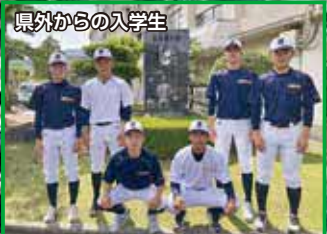
県外からの入学生

文武両道を実践し、甲子園優勝の実績がある池田高校で幼い頃からの夢である甲子園出場を目指したいと思い志望しました。「甲子園に戻る」というテーマで必死に練習しています。先輩方も優しく、気軽に質問しやすい関係を作ってくださいることが自分の成長につながっています。地域の方はよく声をかけて励ましてくださるので、池田に来てよかったと思います。野球部以外の部活動も活気があり、行事も全力で取り組めるととてもいい学校です。