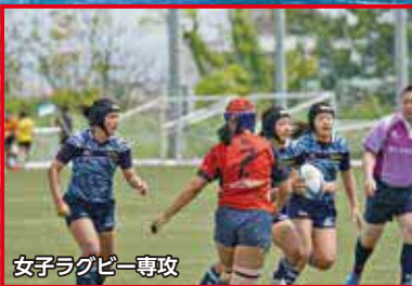
女子ラグビー専攻