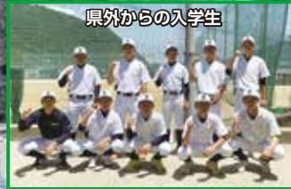
県外からの入学生