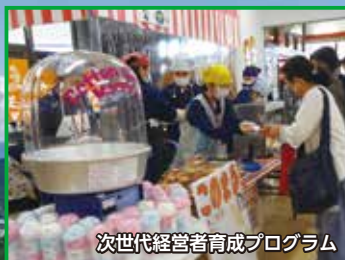
次世代経営者育成プログラム