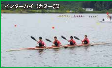
インターハイ (カヌー部)