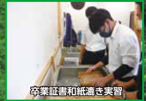
卒業証書と紙漉き実習