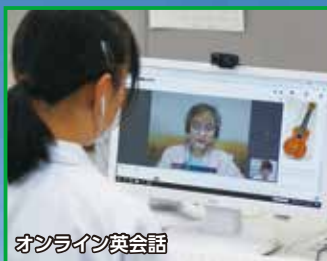
オンライン模会話