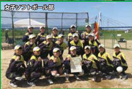
女子ソフトボール部