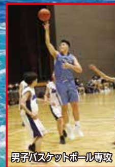
男子バスケットボール専攻