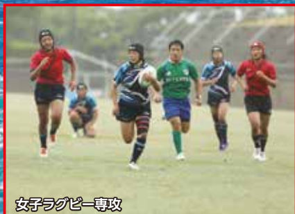
女子ラグビー専攻