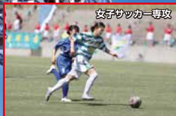
女子サッカー専攻

ラグビー専用の天然芝グラウンドがあり、クラブハウスやトレーニングセンターなどの施設も充実していて、ラグビーに打ち込むことができる環境が整っています。学校では、全国を目指している生徒が多く、とても楽しく活動しています。寮生活では、キッチンや洗濯機が綺麗で使いやすく、快適に過ごすことができます。将来は、管理栄養士としてスポーツ選手のサポートができればと考えています。