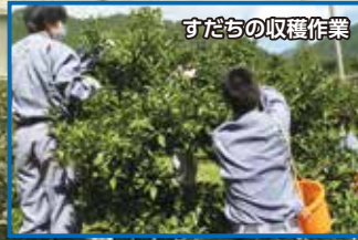
すだちの収穫作業